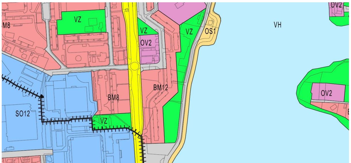
Výřez z územního plánu města.

Dle platného územního plánu jsou pozemky dotčené stavbou evidovány jako BM –Plochy bydlení - městské.